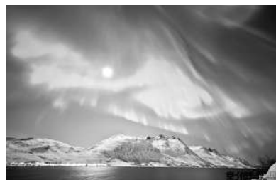
去皇家观测台听一堂天文课

澳大利亚海浪摄影专家Shane Chalker说：“从某种程度上说这张照片是我预先计划好的。作为一个冲浪爱好者，每当我从海浪中划水出来，看到日落时的美丽景色都会被深深震撼。要想拍出这样一张照片，你首先要明白，海水越清澈效果就越好，这些颜色都是阳光透过海水产生的，现在的大海已经受到了污染。”拍摄这张照片时，Shane使用了一支10-20mm的变焦头，他将焦距锁定在10mm，使用快门优先模式将速度调至1/800s，然后减少两挡曝光，防止海浪曝光过度。