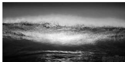
这张海浪照片，色彩饱满，逆光下海浪犹如翡翠一样晶莹剔透。

如果你想去拍摄夜晚的天空，却不知该从何入手，或者你是一位经验丰富的“夜猫子”，需要再来点新的灵感，那么我们的建议就能为你提供很大的帮助。