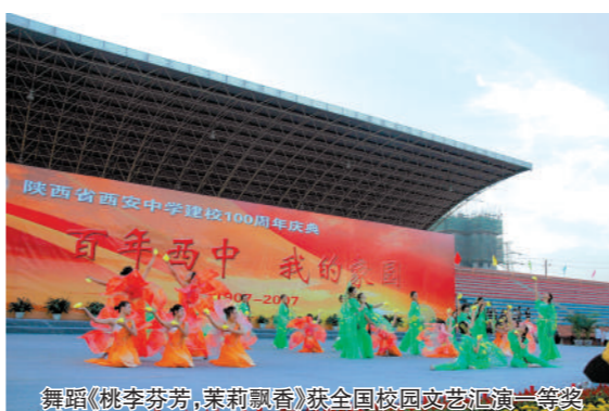
舞蹈《桃李芬芳，茉莉飘香》获全国校园文艺汇演一等奖

舞蹈队自成立以来，多次参与校内各项演出任务，取得了骄人的成绩。校园文化艺术节、元旦迎新晚会等活动中，校舞蹈队积极承担、辛勤付出，为每一个活动都增添了绚丽的光彩。尤其是2010年与西藏民院联谊交流，2011年代表我校参加未央区先进集体表彰文艺汇演以及2013年代表我校参加陕西省直属机关首届文化艺术节展演等高级别演出，受到了广大师生和社会相关部门的一致好评。成绩的取得，是我们继续前进的动力，作为学校的主要社团之一，我们今后将在学校各级领导的正确带领下，向着专业化、规范化、特色化的目标继续奋斗，努力将舞蹈队打造成一支高标准、高水平、高素质的专业化团队。 舞蹈队是青春飞扬的起点，是激情点燃的地方，是你我铸造个性、美丽心灵的殿堂，我们始终坚信：心有多大，舞台就有多大！