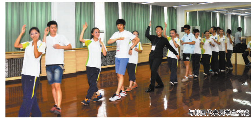
与韩国代表团学生交流