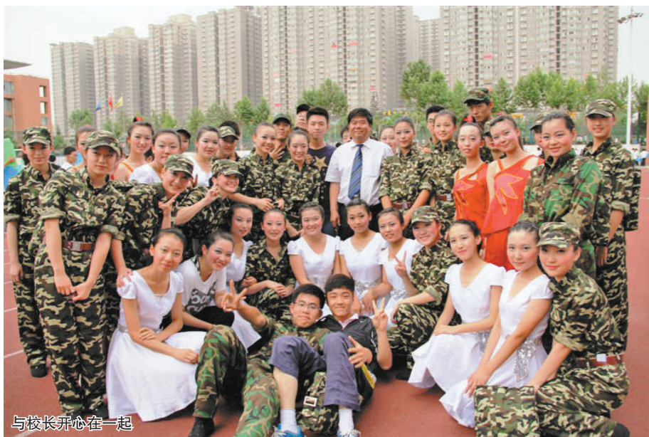
与校长开心在一起

舞蹈队自成立以来，多次参与校内各项演出任务，取得了骄人的成绩。校园文化艺术节、元旦迎新晚会等活动中，校舞蹈队积极承担、辛勤付出，为每一个活动都增添了绚丽的光彩。尤其是2010年与西藏民院联谊交流，2011年代表我校参加未央区先进集体表彰文艺汇演以及2013年代表我校参加陕西省直属机关首届文化艺术节展演等高级别演出，受到了广大师生和社会相关部门的一致好评。成绩的取得，是我们继续前进的动力，作为学校的主要社团之一，我们今后将在学校各级领导的正确带领下，向着专业化、规范化、特色化的目标继续奋斗，努力将舞蹈队打造成一支高标准、高水平、高素质的专业化团队。 舞蹈队是青春飞扬的起点，是激情点燃的地方，是你我铸造个性、美丽心灵的殿堂，我们始终坚信：心有多大，舞台就有多大！