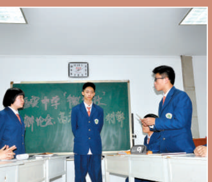
针锋相对各说各的理

利于人的真正发展。 四、中国的男生普遍理科强,女生文科强。如果文理不分科,会使许多学生的能力不能尽情发挥,只能因为文科或理科,因禁于一个很小的范围,无法成才。 所以,对于高考改革中的文理不分科,我持反对意见。