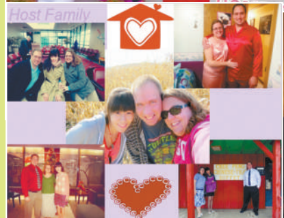
初次见到我的“新家庭”时,为时两天的艰辛和疲惫瞬间随着他们亲切而温暖的笑容消退了去