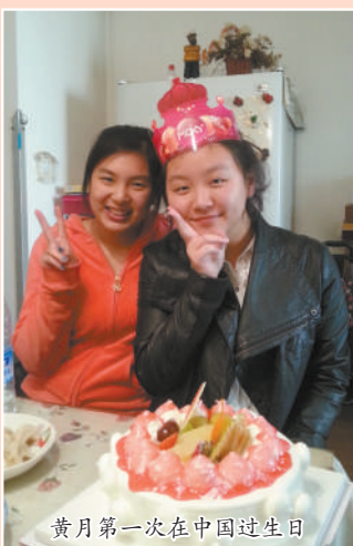
黄月第一次在中国过生日

我会把这一次的古城之旅所感受的点点滴滴都记在心里。我的家人和同学们,你们都是我在西安最美好的回忆。再见西安,再见中国,我会再回来的。