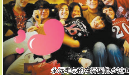
永远难忘的在异国他乡过16岁生日

的紧张激动和独自国际机场逗留的惶恐不安至今仍历历在目。到达我所在的州——密歇根州时,是夏末的一个黄昏,我在西密歇根的一个小村庄的机场初次见到我的“新家庭”时,为时两天的艰辛和疲惫瞬间随着他们亲切而温暖的笑容消退了去。我被分配到的家庭是一对去年刚刚结婚的年轻夫妇,没有孩子。妈妈是专门照顾别人家孩子的专职保姆,爸爸还在大学学习,等待毕业。令我颇感幸运的是,几乎没有费什么力气就融入了他们的生活。当天在机场见面后,我们没有直接回家,他们带我到密歇根湖,感受了在美国的第一次落日。密歇根州坐落在五大湖区,