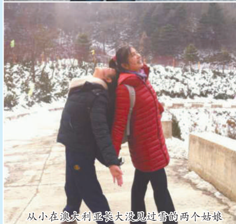
从小在澳大利亚长大没见过雪的两个姑娘