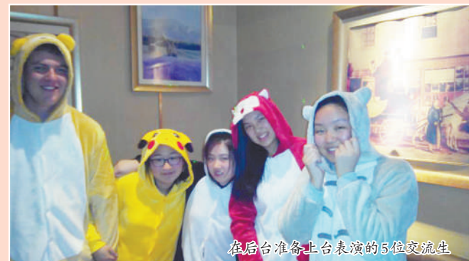
在后台准备上台表演的5位交流生

了他们家里的家庭成员。第一天上学是一个非常冷的早晨,每个人从嘴里吐出的白气因为黑暗的天空而更加明显。我们五个交换生站在学校的操场等待着校会的开始。在那一天校会