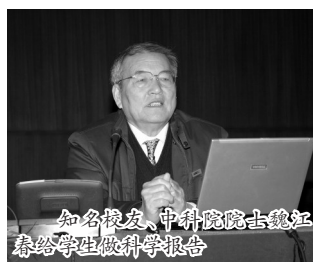
知名校友、中科院院士魏江春给学生做科学报告