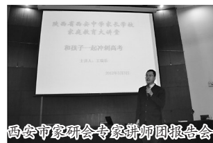
西安市家研会专家讲师团报告会