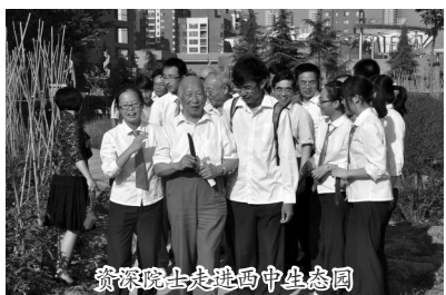
资深院士走进西中生态园