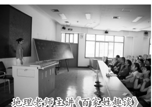
地理老师主讲《百家姓趣谈》

《文景讲堂》主讲人均由西安中学各学科老师担任,内容涉及自然科学和社会科学许多领域,它既是学科教学的延伸和拓展,又是科技最前沿知识与重大社会话题的介绍和说明。“文景讲堂”面向各年级学生,在学校统一的课余时间学生可自由听讲。自2006年开办以来,讲堂已成功举办180场,有176位老师参与,听讲学生达数万多人次。在这里,老师们给你打开了另一个丰富多彩的知识天地。