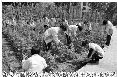
在生态园劳动,对都市里的孩子来说很难得