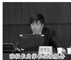
张校长为家长们做报告

西安中学历来重视家校的沟通与交流,成立有家长委员会,设立《家教论坛》定期召开家长会,举办开放日,邀请家长走进课堂,让家长及时了解学校管理、老师上课以及孩子学习等情况。每年高考前夕,张校长都会为家长们做填报志愿的报告,深受家长们好评。同时,学校经常会邀请家庭教育方面的专家为家长们做专题报告,指导家长和孩子一起成长。