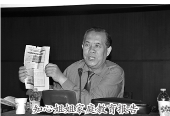
知心姐姐家庭教育报告