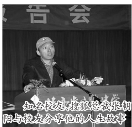
知名校友、搜狐总裁张朝阳与校友分享他的人生故事