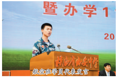
航空班学员代表发言