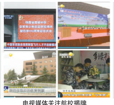
电视媒体关注航校揭牌