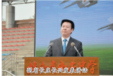
副省长庄长兴发表讲话