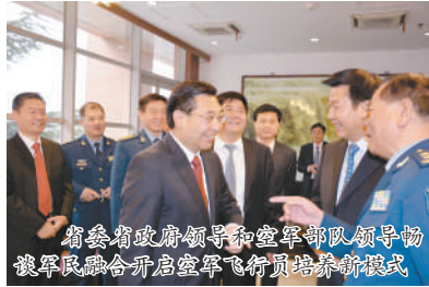
省委省政府领导和空军部队领导畅谈军民融合开启空军飞行员培养新模式

揭牌仪式后,我校师生和文艺社团与空政文工团的著名演员杨树泉、肖雄、吴京安、刘敏、刘和刚以及家长代表、西部歌王王向荣一起为大家带来了一场精彩的文艺演出。(信息中心 张莉)