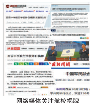
网络媒体关注航校揭牌