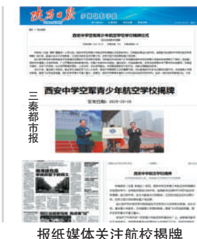
报纸媒体关注航校揭牌

CCTV-4、陕西电视台新闻频道、陕西卫视、陕西电视三套《都市快报》、深圳卫视、湖北卫视、陕西日报、三秦都市报、华商报、陕西传媒网、新华网等媒体前来采访报道。网络媒体更是纷纷转载,陕西传媒网、华商报以及中国新闻网、新华网、网易、搜狐等各地网络媒体都有转载报道。