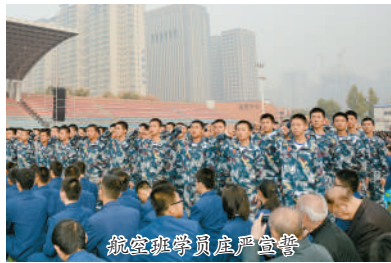
航空班学员庄严宣誓