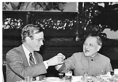
1982年5月8日，邓小平和美国副总统布什就就对台军售问题进行了一个半小时的会谈。会后两人进餐。

布什返美后，向里根转达了中方的立场。此后，由于黑格与里根的矛盾(包括在对华关系和美欧关系上的分歧)日益加剧，导致黑格于6月25日辞职。